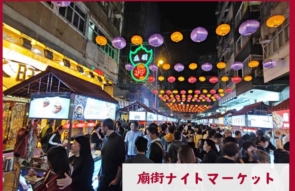
廟街ナイトマーケット