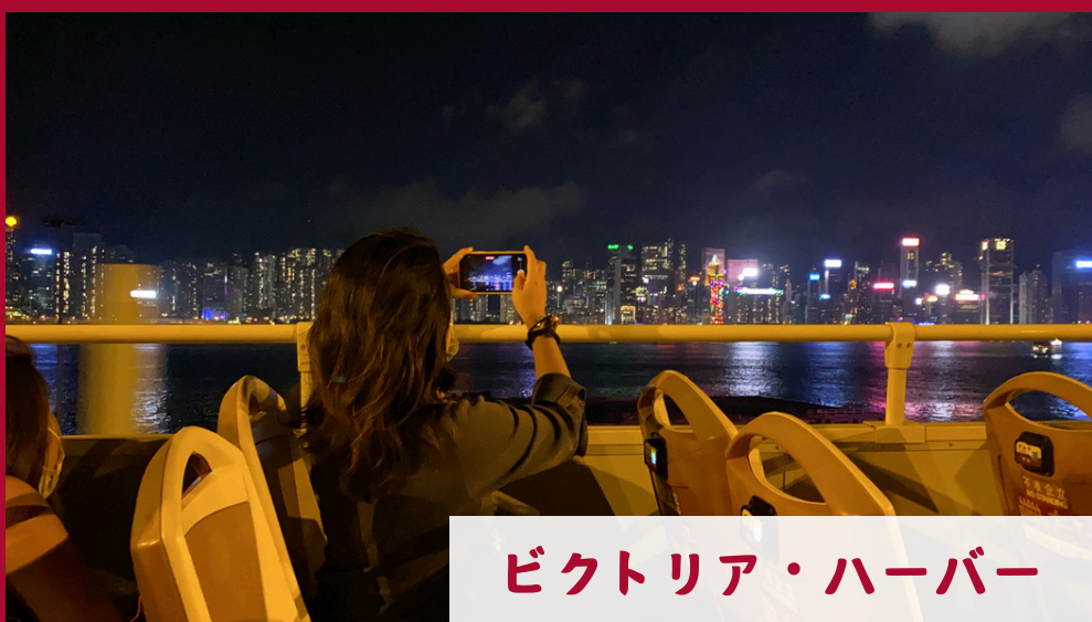
ビクトリア・ハーバー