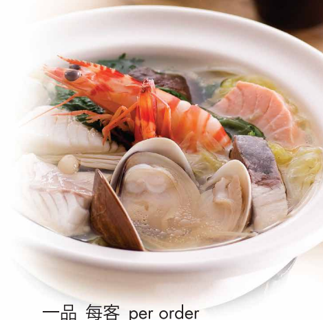
一品 每客 per order